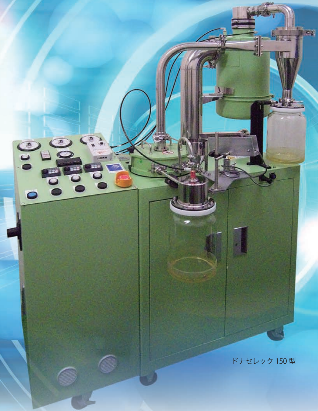
ドナセレック 150 型